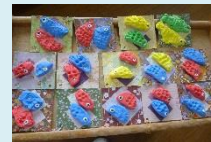
粘土細工での 鯉のぼり作成