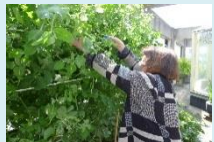
屋上菜園での収穫